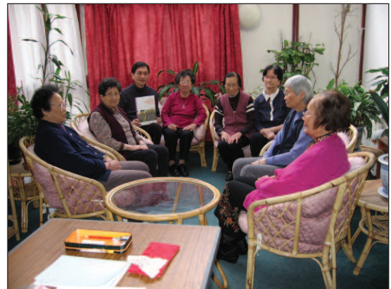
ਯੋਜਨਾ ਤਾਲ-ਮੇਲ ਕਰਤੇ ਕੇਂਦਰ ਸਮੂਹ ਵਿਚਾਰ ਵਟਾਂਦਰਾ ਕਰਦੇ ਹੋਏ